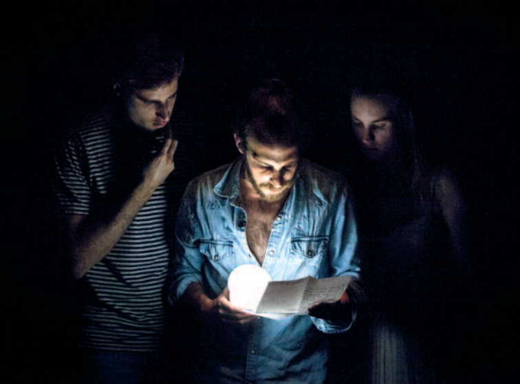
Non c'est pas ça ! [Treplev variation]